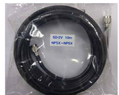
同軸ケーブル加工品